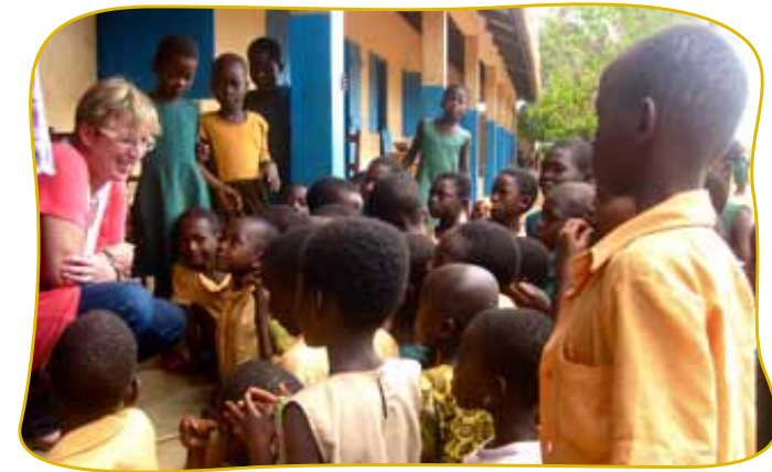
Vom interkulturellen Austausch profitieren alle

Die Vernetzung von Lerninhalten sowie das eigenständige und kooperative Arbeiten lassen sich besonders gut in der Projektarbeit umsetzen. Wir schätzen diese Methode sehr. Zum Beispiel beteiligen wir uns regelmäßig an „Rock Our World“. Hier verbinden sich die Schüler - natürlich auf Englisch - mittels Video-Chats mit anderen Schülern in aller Welt, erstellen mit ihnen gemeinsame Songs und Multimedia-Präsentationen zu Themen wie „Healthy Food and Sustainability“, „Chocolate Recipes“ und „Poetry Slam“. Auch mit anderen Projekten, wie z.B. regelmäßigen Hofbesuchen auf Gut Wulksfelde, fördern wir handlungsorientiertes Lernen.