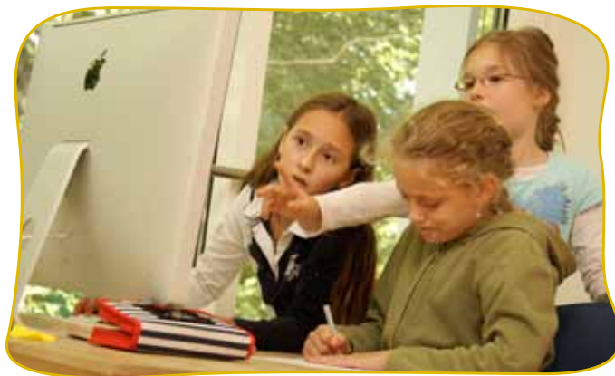
Moderne Medien bereichern den Unterricht